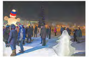
Полночь у ёлки в парке