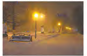
Улица новых фонарей

Юных горожан начали развлекать ещё задолго до наступления Нового года. Увеселительные мероприятия и ёлки яркой чередой прошли в Анжеро-Судженске. А 26 декабря на сцене ДК «Центральный» ребятам показали спектакль «Тайна зачарованного мира».