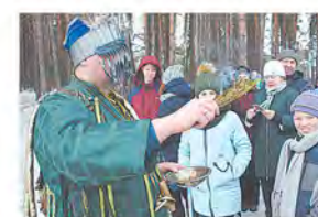
«Белые» помыслы русского шамана