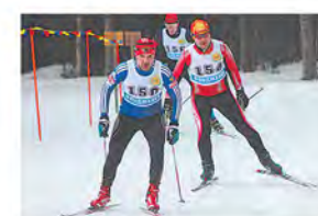
Последняя лыжня зимы