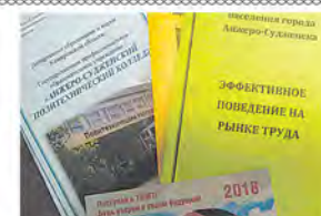
Ярмарка для девятиклассников